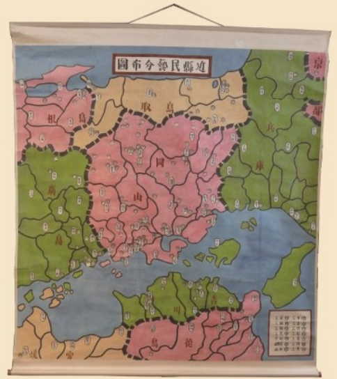
柚木沙弥郎(推定) 《近県民芸分布図》 1948年