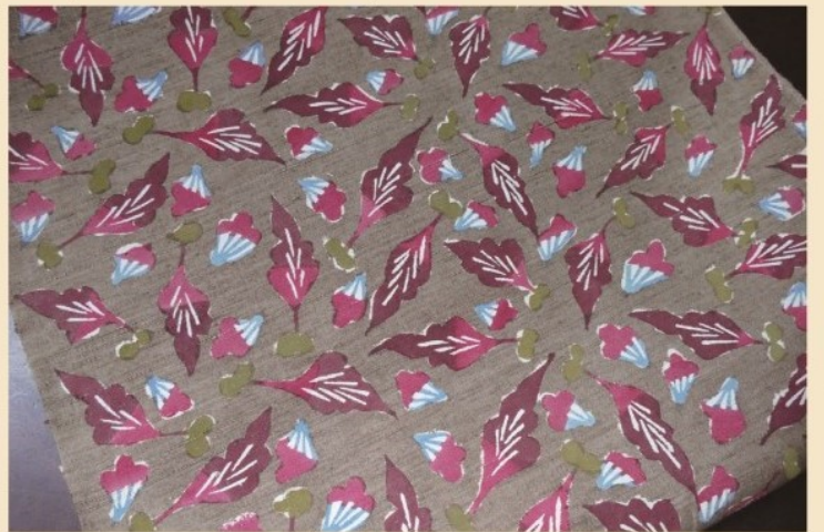
柚木沙弥郎《型染帯地》1967年